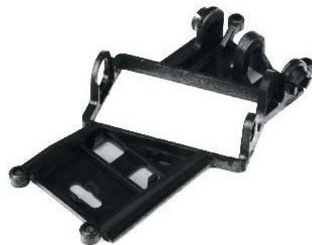
Fig. 1: Soporte motor CH29

Els equips que disputin les 24 Hores podran sol·licitar-ne un altre en cas que ho desitgin.